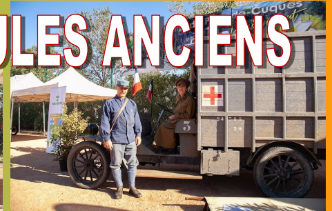
Photos 14 e salon des véhicules anciens 2023