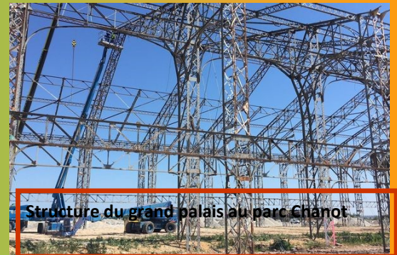
Structure du grand palais au parc Chanot